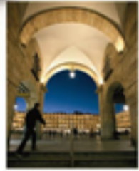
LA PLAZA MAYOR

TARJETA TURÍSTICA 24 horas: 19 euros / 48 horas: 23 euros