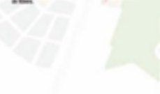
LA PLAZA MAYOR

Este palacio es una de las obras maestras de la arquitectura renacentista en Salamanca. Fue construido por el conde de Monterrey en el siglo XVI. Destaca por su fachada renacentista y su gran interior. Es un ejemplo perfecto de la arquitectura renacentista en España.