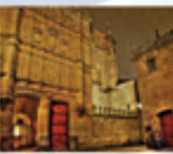
EL PUENTE ROMANO

Este puente romano es una de las joyas de la ciudad de Salamanca. Fue construido en el siglo I d.C. por el emperador romano Trajano. Destaca por su estructura de piedra y su gran longitud. Es un ejemplo perfecto de la arquitectura romana en España.