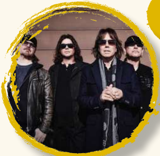
EUROPE 14 sept | 22:00h