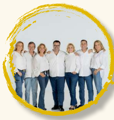
SIEMPRE ASÍ 7 sept | 23:00h