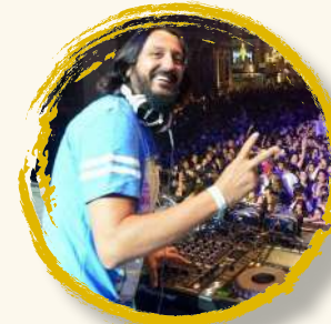
LOS 40 SESSIONS 10 sept | 22:00h