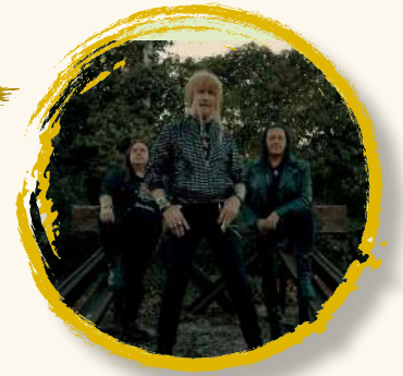
MEDINA AZAHARA 9 sept | 22:00h