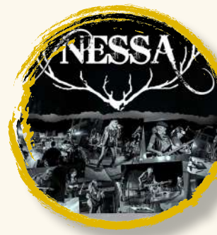
NESSA 8 sept | 20:30h