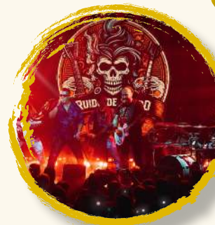
RUIDO DE FONDO 14 sept | 20:30h