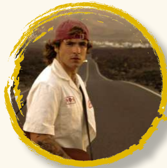
NOAN 13 sept | 20:30h