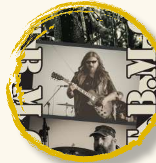
TBMC 10 sept | 20:30h