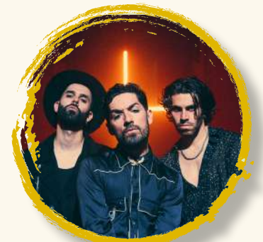
SILOÉ 11 sept | 22:30h