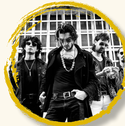
ULTRALIGERA 11 sept | 20:30h (concierto Caja Rural)