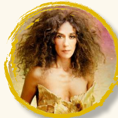
ROSARIO 8 sept | 22:00h