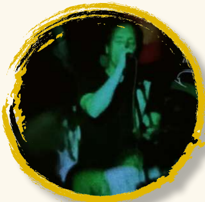
BENBOW 7 sept | 21:00h