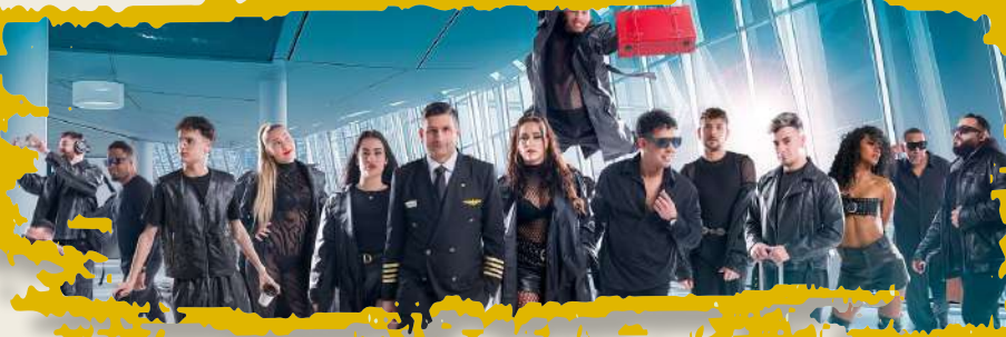
ORQUESTA LA FÓRMULA 6 sept | 22:00h