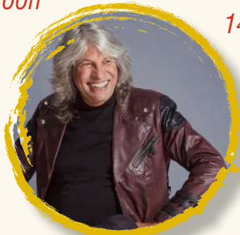
JOSÉ MERCÉ 15 sept | 22:00h