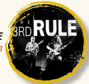
THE THIRD RULE 9 sept | 20:30h