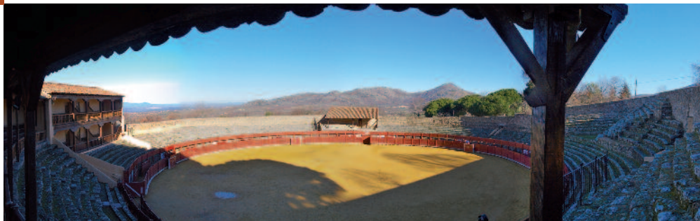
Plaza de toros de Béjar, "La ancianita".